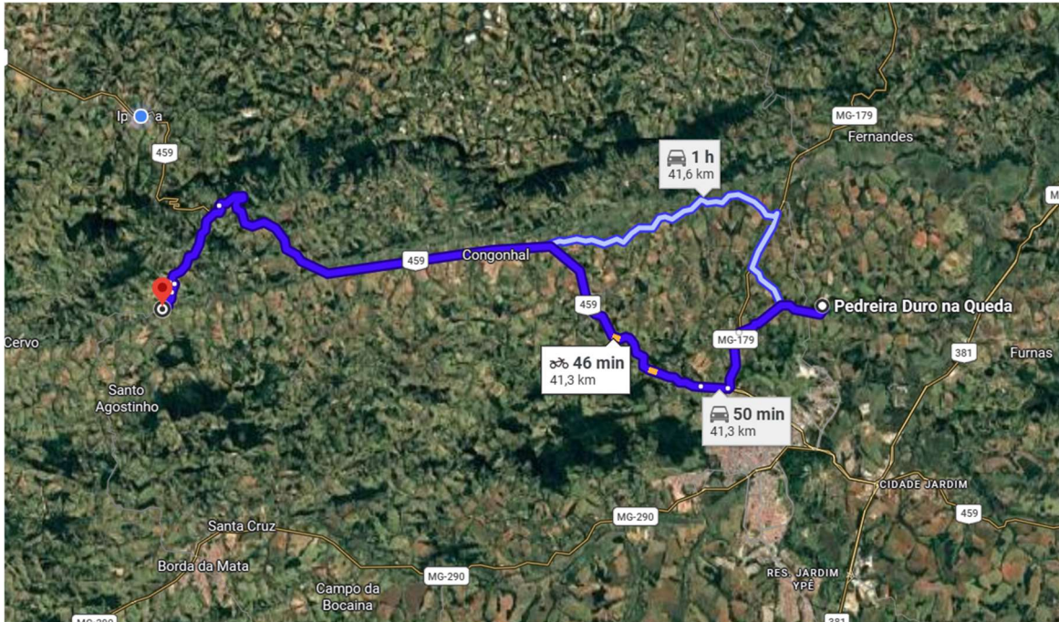
Distância entre o local da obra e a Pedreira Duro na Queda: 41,3 km